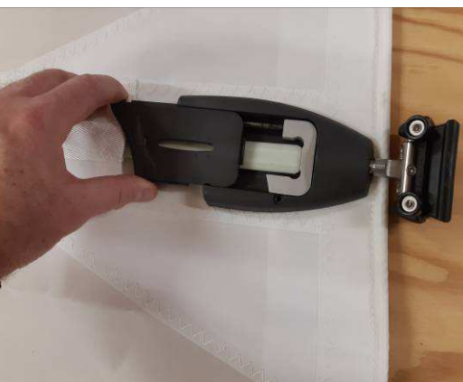
Reglissez le capot du boîtier bien à fond