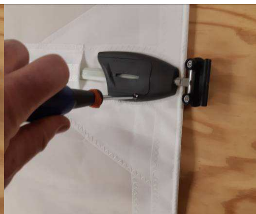
Vissez la vis du capot