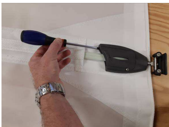
Régalez légèrement la tension avec la vis sans fin du boîtier à l'aide d'un tournevis.