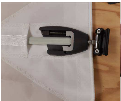
Guidez et bloquez la latte dans le boîtier