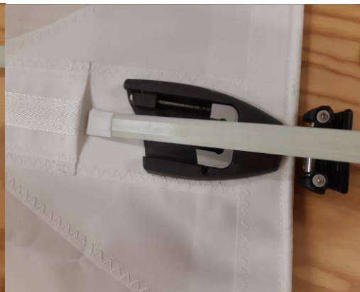
Introduisez la latte dans le gousset bien droite et sans forcer