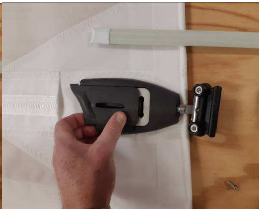
Glissez le capot vers l'arrière pour le retirer du boîtier