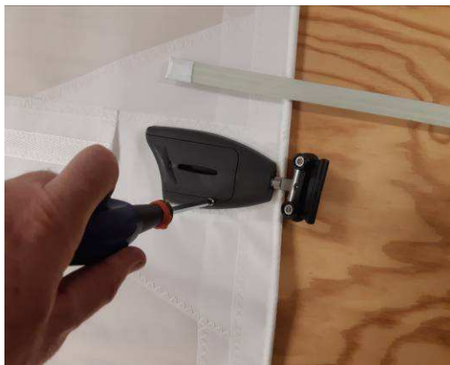
Dévissez la vis retenant le capot du boîtier fermé